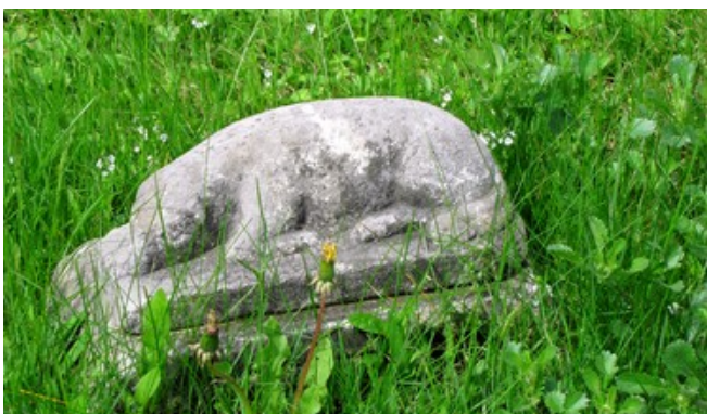
Cimetière de l'église unie Candlish United Church. Agneau.

L' agneau : Cet autre symbole chrétien est lié à la fête de Pâques et à la résurrection du Christ. Dans les cimetières protestants du Québec, l'agneau est le plus souvent associé à la mort d'un enfant pour représenter l'innocence et la pureté.