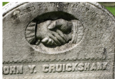
Cimetière de l'église unie Candlish United Church. Poignée de mains.