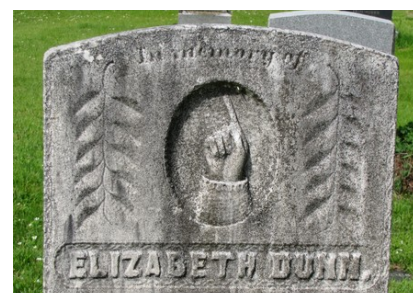
Cimetière de l'église unie Candlish United Church. Main pointée vers le ciel et deux branches de laurier.