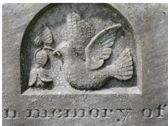
Cimetière de l'église anglicane St. Mark. Colombe.