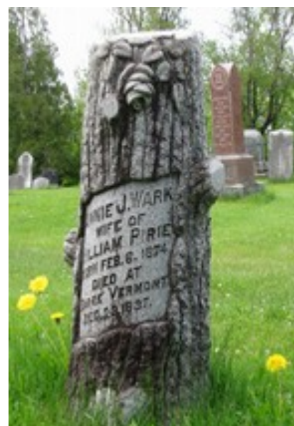
Cimetière de l'église unie Candlish United Church. Rose et arbre coupé.

La main pointée vers le haut : Elle réfère au ciel et à la prière.