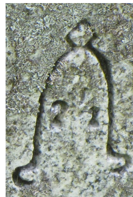
Cimetière de l'église anglicane St. Mark. Chaîne d'union et degré 2 1/2.