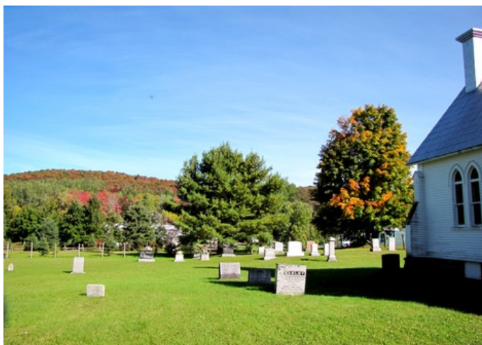
Cimetière de l'église anglicane St. Mark.