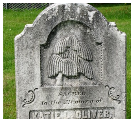
Cimetière de l'église unie Candlish United Church. Saule pleureur.

Les fleurs : Puisque les fleurs ont une durée de vie très courte, elles rappellent le caractère éphémère de la vie.