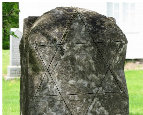
Cimetière de l'église unie Candlish United Church. Étoile de David.