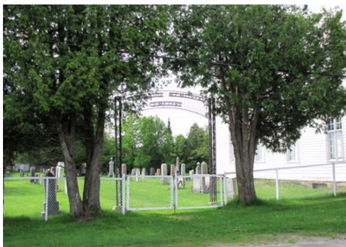
Cimetière de l'église unie Candlish United Church.

Plusieurs raisons peuvent nous attirer dans un cimetière : se recueillir sur la tombe d'un disparu, retrouver la trace de ses ancêtres, s'accorder un moment de tranquillité. Ce que je vous propose ici, c'est autre chose.