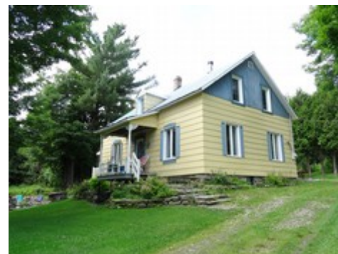
16- Route Eager.