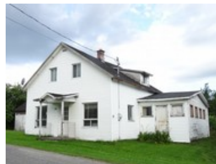
1- Rue des Fondateurs.