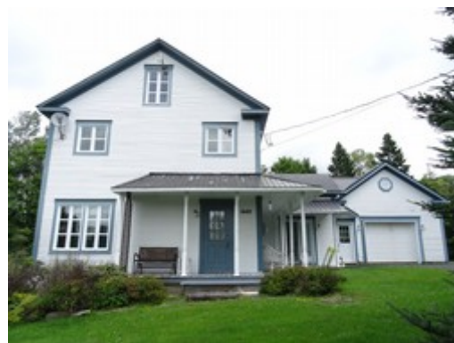
3- Rue du Foyer.