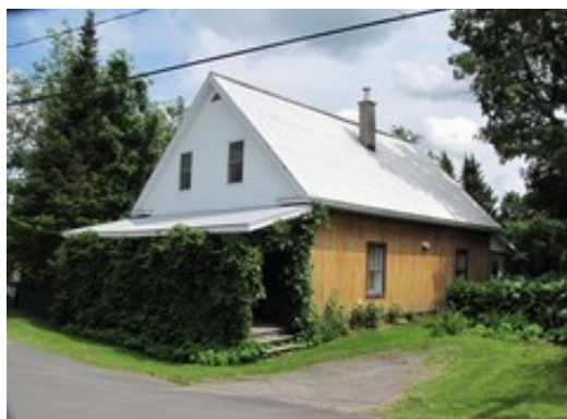
2- Rue des Fondateurs.