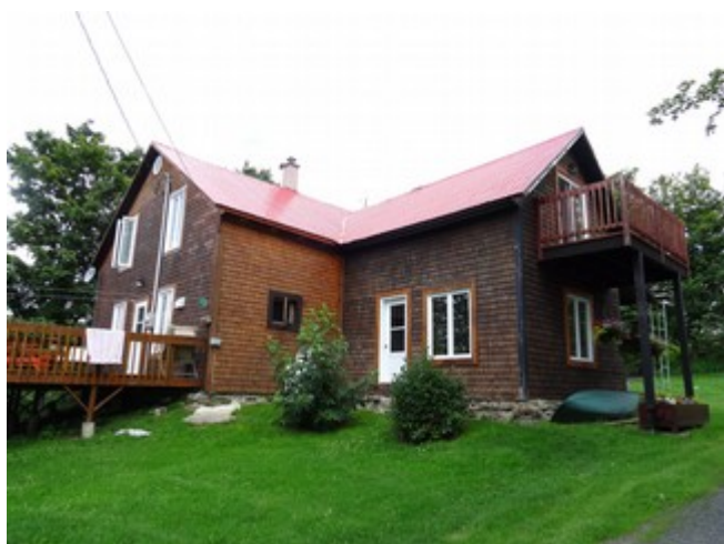
11- Route 269.

Cette maison, ayant appartenu longtemps à la famille Prévost, est située face à la route du 4 e Rang.