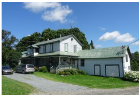
6- Rang Allan.

Cette maison fut bâtie par la famille Thompson dans les années 1850. Elle est acquise au début du XX e siècle par la famille Nugent dont les descendants continuent de l'habiter. Avant que le toit soit surélevé, elle était semblable à la maison des Allan.