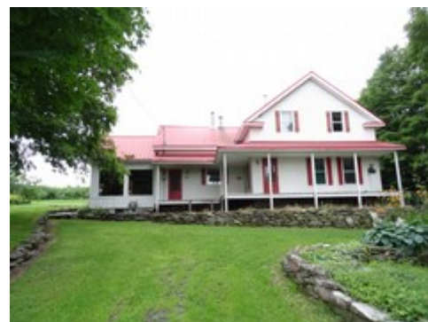
15- 3 e Rang.

Sans connaître l'âge exact de ces trois maisons, elles pourraient remonter vraisemblablement aux années 1880, à l'époque où ces routes ont été ouvertes.