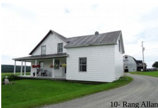
10- Rang Allan.