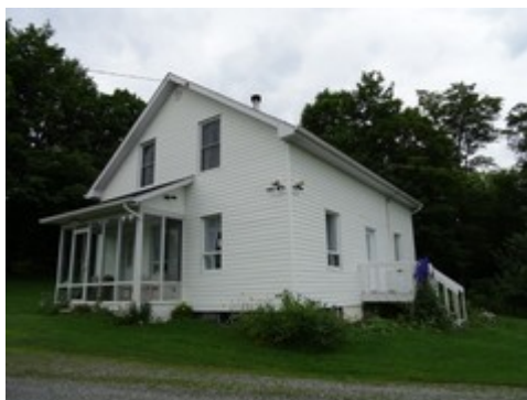
14- 3 e Rang.

Les deux routes apparaissent vers les années 1870-1880. À noter que la route Eager a remplacé l'ancien chemin Trépanier, dont le parcours trop abrupt rendait difficile l'accès au chemin Craig.