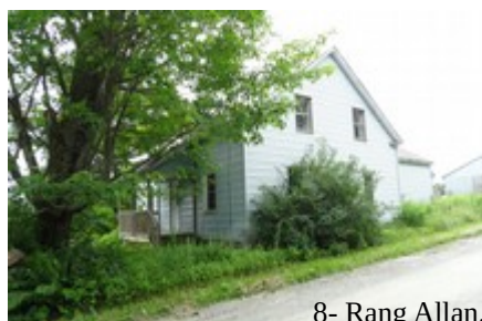
8- Rang Allan.

Ces deux maisons habitées autrefois par les Allan sont aussi issues du XIX e siècle. Celle de droite fut érigée en 1877 et celle du bas, en 1886 .