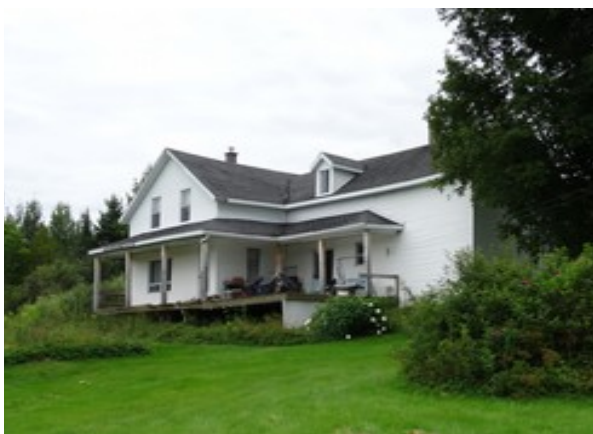
12- Route 269.

En effet, le recensement de 1861 indique que ce terrain était habité dès cette époque. La maison pourrait donc avoir été construite avant cette date, du moins en partie.