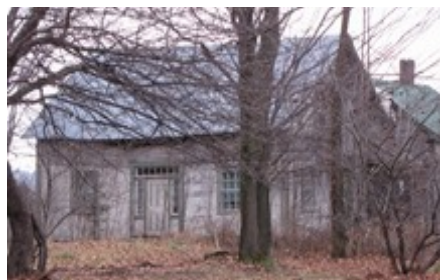
9- Rang Allan.