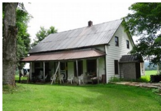
5- Rang Allan.

La maison actuelle date de 1857, mais on peut penser qu'elle résulte d'un agrandissement de la première habitation des ancêtres Allan.