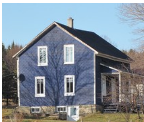
17- Rang Magwood.

La maison ci-dessus fut construite en 1887. La maison ci-contre pourrait être de la même époque, sinon être plus ancienne, car la famille Magwood est venue s'installer sur ce lot entre 1851 et 1861.