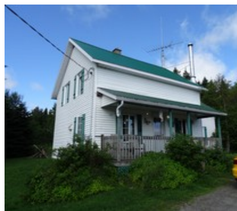
18- Rang Magwood.