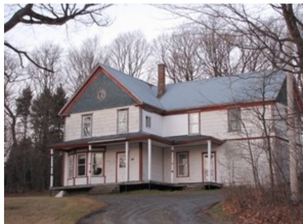
13- Route 269.

Ces deux autres maisons du rang 5 ont été bâties selon un modèle semblable à celui de la maison Prévost, avec leurs deux étages et leur plan en « L ». Elles seraient vraisemblablement du même âge et pourraient aussi avoir été agrandies postérieurement.