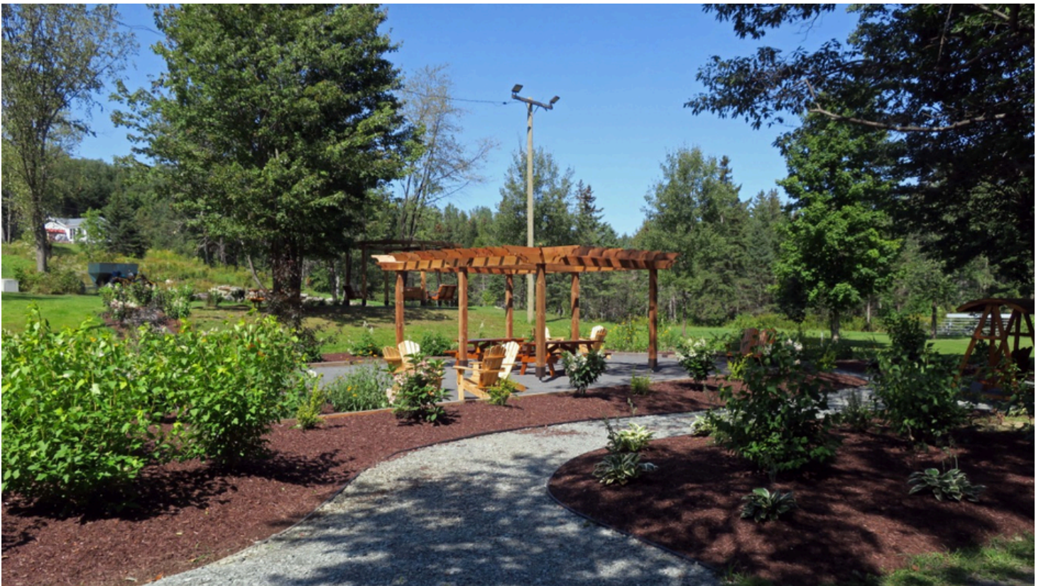
Le jardin Desjardins à Kinnear's Mills

Vous pouvez consulter les éditions du « Sons d'Cloches » sur le site internet de la municipalité, ou encore vous abonner à l'infolettre afin de le recevoir chaque mois directement dans votre boîte courriel !